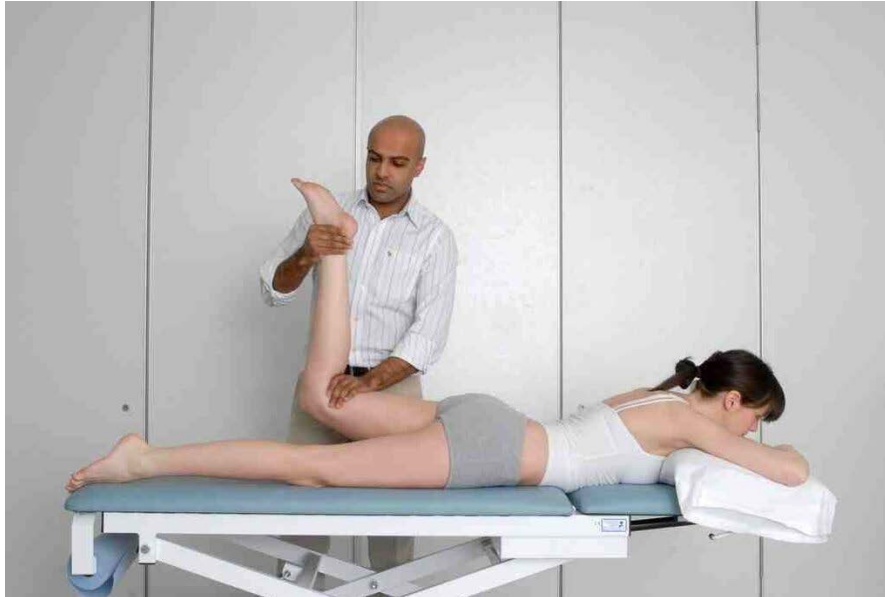
L'examen du nerf crural étiré: L'extension de la hanche.