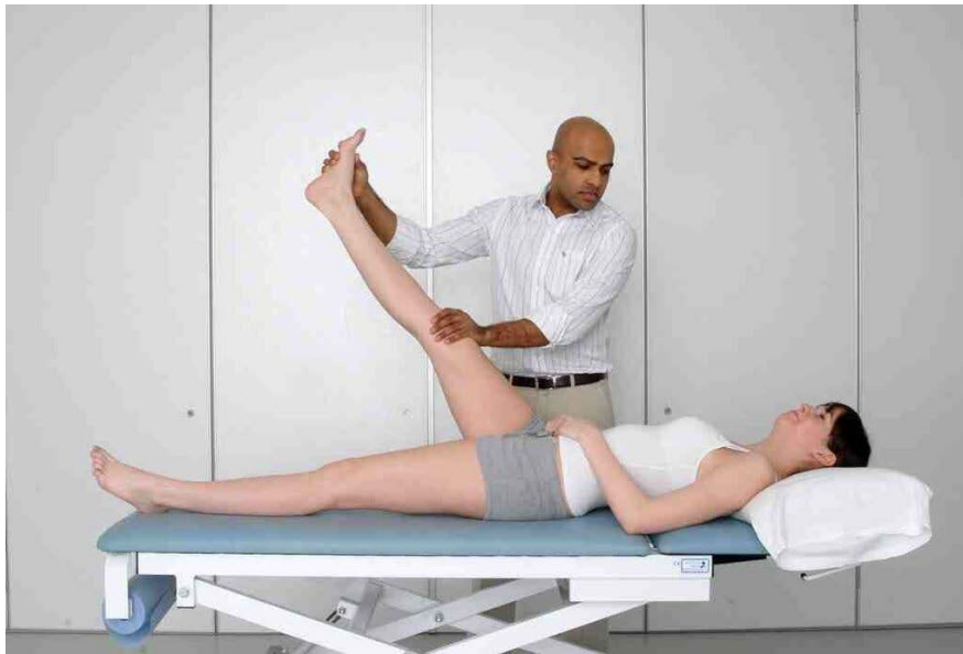
Lever la jambe droite avec la cheville tenue en dorsiflexion.