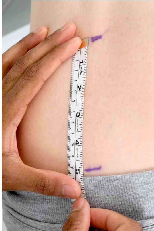
Le Test de Schober: Les marques sont maintenant à 12.5cm l'une de l'autre.