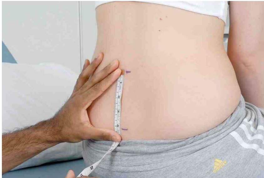
Le Test de Schober: Les marques à 10cm l'une de l'autre.