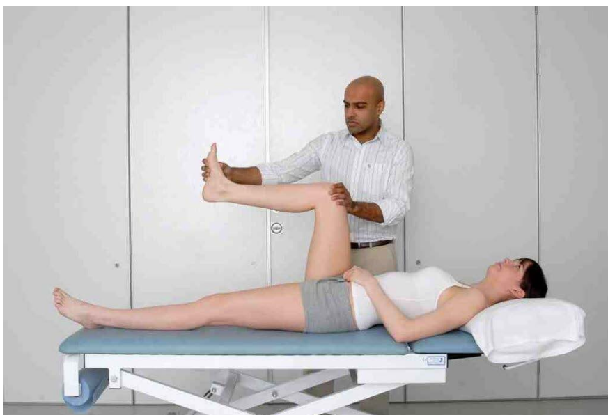
Démonstration du signe de Lasègue: Le pied neutre, le genou fléchi.