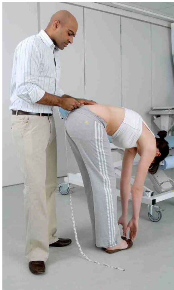
Le Test de Schober: Le patient fléchit la colonne vertébrale (se penche vers l'avant).